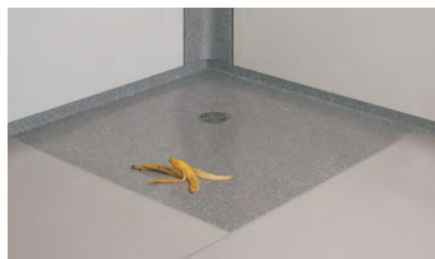
Duschwanne und Boden in unterschiedlicher Materialausführung

Unsere Innovation CRIFFIT® garantiert festen Halt auf Bodenflächen und in allen Duschwannen aus CREANIT®. Die Spezialbeschichtung ergänzt die Vorteile des WANDOVARIO®-Systems um einen weiteren Pluspunkt.