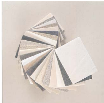
CREANIT ist langlebig, homogen und porenlos: Es erfüllt das höchste Maß an Wohnkultur im Sanitärbereich.

Grundsätzlich werden alle Verkleidungen und Fronten so gefertigt, dass eine silikonlose und hinterlüftete Ausführung gewährleistet wird.