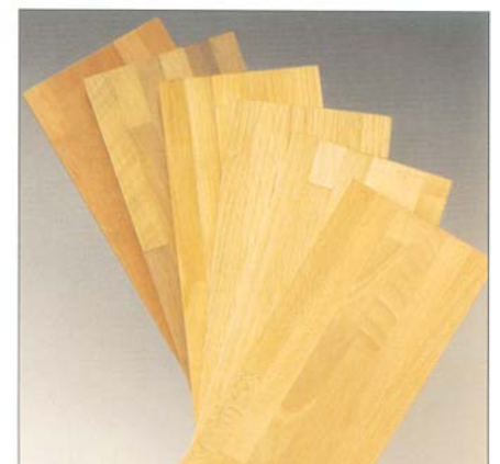
KreativHolz ist die vielseitige Massivholz-Oberfläche mit der garantierten Schutzsperr.