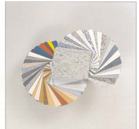
HPL-Schichtstoffplatten haben eine Vielfalt an Farben. 150 unterschiedliche Dekors bietet die Palette derzeit an.